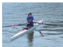
JOC エリートアカデミーに入校し、海外遠征などに参加

J-STAR 修了後、有望選手は、各中央競技団体の強化・育成コースに選出。オリンピック、パラリンピックをはじめ、世界で活躍できるトップアスリートを目指すために引き続きトレーニングを重ねていく機会が得られます。